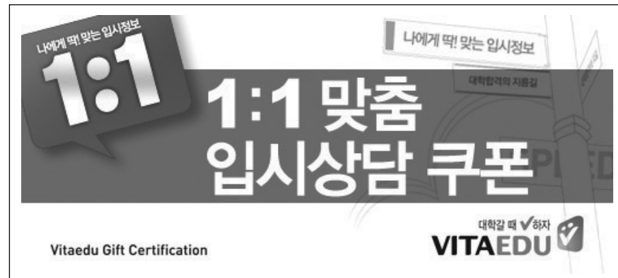
합격예측서비스 30% 할인 쿠폰

※ 비타에듀 입시컨설팅 이용 방법 : 비타에듀(www.vitaedu.com) > 입시정보 > 비타입시컨설팅 > 합격예측서비스/지원가능대학 서비스